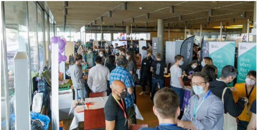
Ein Eindruck von der Kontaktparty 2022

Für die insgesamt über 1'900 Bachelor- und Masterstudierenden der Informatik, Data Science und Computational Biology und Bioinformatics ist der VIS die erste Anlaufstelle für Events, Exkursionen, Unterstützung im Studium, sowie die Vertretung gegenüber dem Departement für Informatik der ETH Zürich. All diese Angebote, vom Begrüssungswochenende für Erstsemestrige, über Prüfungsvorbereitungskurse für die wichtigsten Klausuren bis hin zur grössten akademischen IT-Recruitingmesse der Schweiz, werden von etwa 120 Studierenden komplett ehrenamtlich neben ihrem Studium organisiert. Der VIS ist Teil des Verbands der Studierenden an der ETH Zürich ( VSETH ), der als Dachverband sämtlicher Studierendenorganisationen an der ETH, die über 20'000 Studierenden gegenüber der gesamten Universität hochschulpolitisch vertritt. Wie der VIS ist auch der VSETH im studentischen Leben abseits der Vorlesungssäle allgegenwärtig.