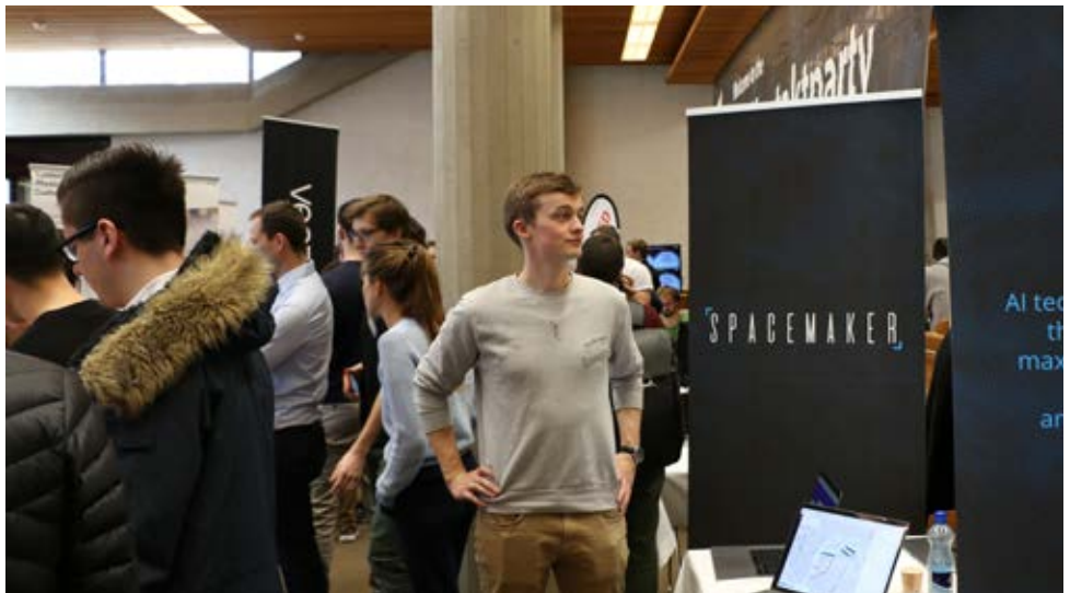
Ein Eindruck der Startup Sektion von der Kontaktparty 2019