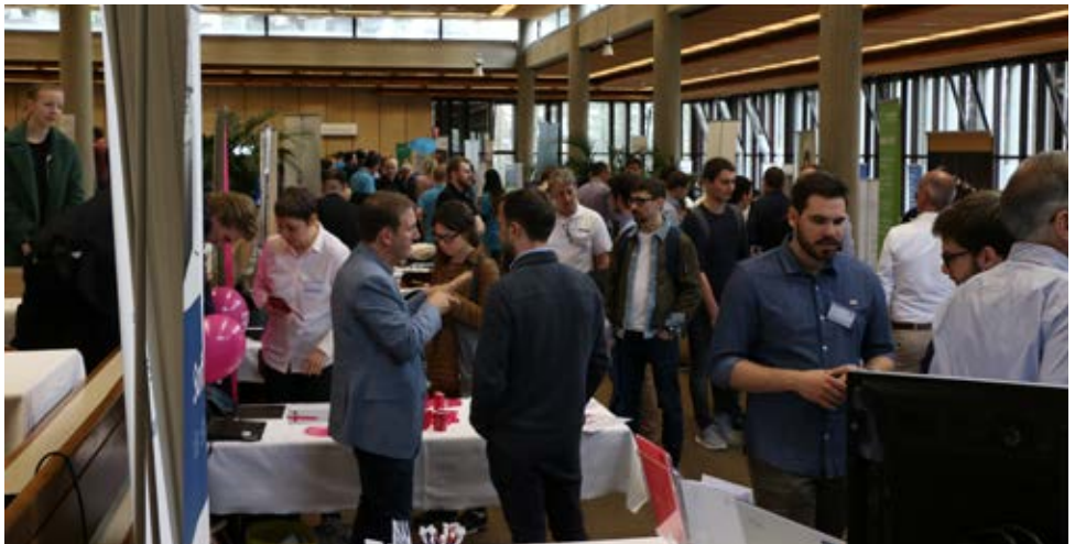
Ein Eindruck von der Kontaktparty 2019

Für die insgesamt über 1'900 Bachelor- und Masterstudierenden der Informatik, Data Science und Computational Biology und Bioinformatics ist der VIS die erste Anlaufstelle für Events, Exkursionen, Unterstützung im Studium, sowie die Vertretung gegenüber dem Departement für Informatik der ETH Zürich. All diese Angebote, vom Begrüssungswochenende für Erstsemestrige, über Prüfungsvorbereitungskurse für die wichtigsten Klausuren bis hin zur grössten akademischen IT-Recruitingmesse der Schweiz, werden von etwa 120 Studierenden komplett ehrenamtlich neben ihrem Studium organisiert. Der VIS ist Teil des Verbands der Studierenden an der ETH Zürich ( VSETH ), der als Dachverband sämtlicher Studierendenorganisationen an der ETH, die über 20'000 Studierenden gegenüber der gesamten Universität hochschulpolitisch vertritt. Wie der VIS ist auch der VSETH im studentischen Leben abseits der Vorlesungssäle allgegenwärtig.